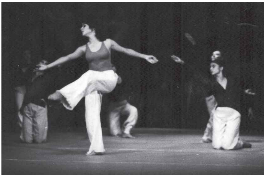
“Siempre fue esa mi intención: crear un grupo de danza que se dedicara exclusivamente a bailar, a formar bailarines profesionales y salir de gira”.