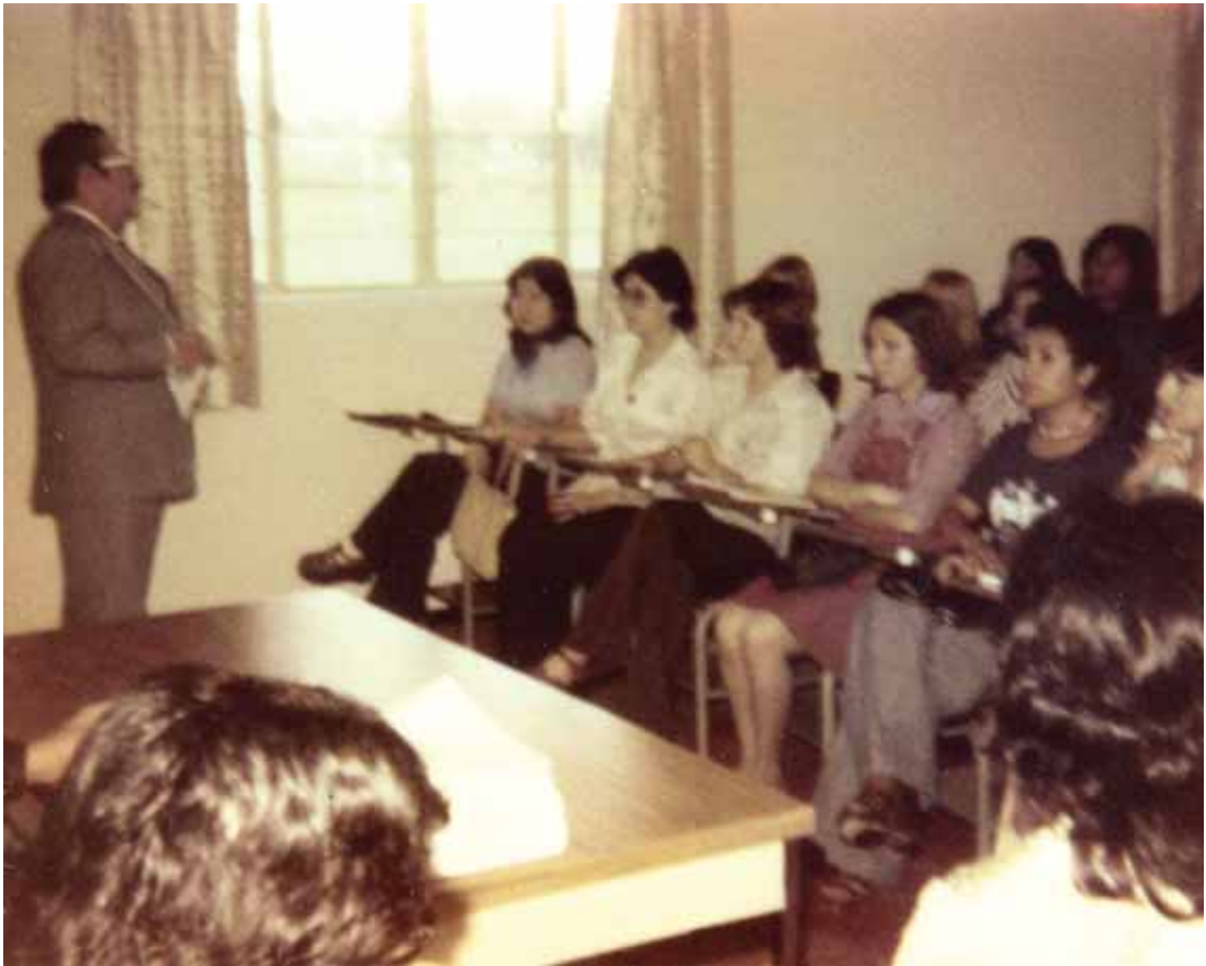
Primer día de clases con la asistencia de 50 alumnos matriculados en la licenciatura.

El doctor Emilio Cruz Aubry expresó: “La trascendencia de la nutrición en México es fundamental, ya que es necesario ante todo mejorar la alimentación del pueblo, sin distinción de clases ni categoría. Encuadrar alternativas, adaptarse a las necesidades que requiere el país, producir elementos útiles, son las metas que nos hemos fijado. Mientras no haya un apoyo vertical oficial a los planes de salud, México no podrá salir de esta etapa de transición y subdesarrollo”.