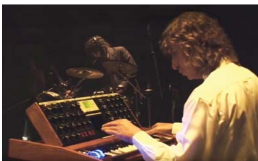
En concierto en el Aula Magna del Colegio Civil Centro Cultural Universitario, ejecutando sus composiciones Electrophonia X y XII , el 10 de septiembre de 2013.