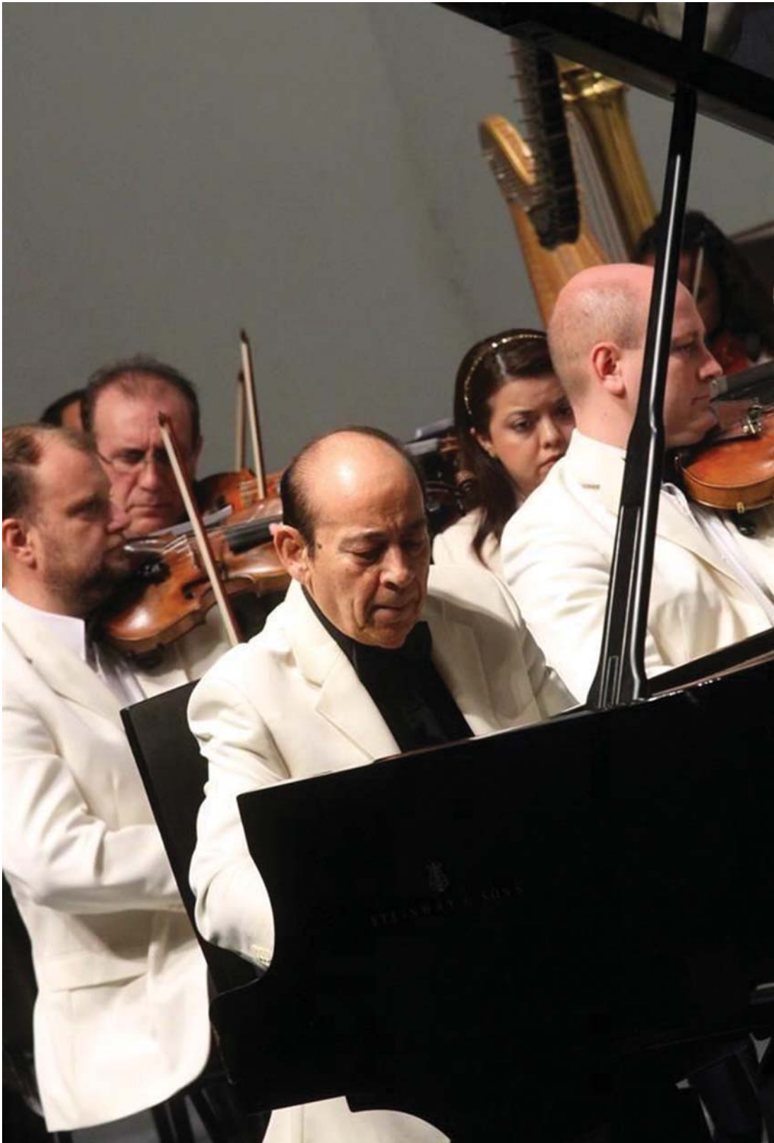
El músico en una presentación con la Orquesta Sinfónica de la UANL. En una entrevista concedida en 2007 declaró: “Y me voy a morir en el piano, si es posible”.