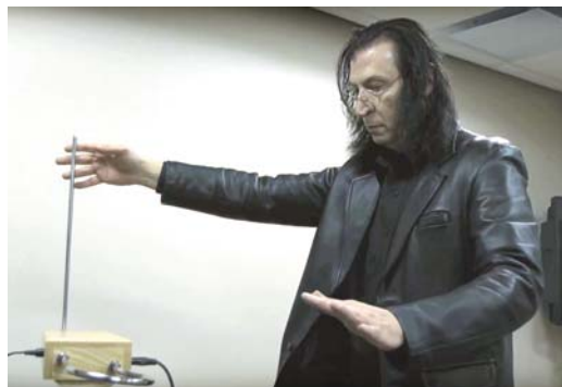
Trabajando en sus composiciones en 2014.