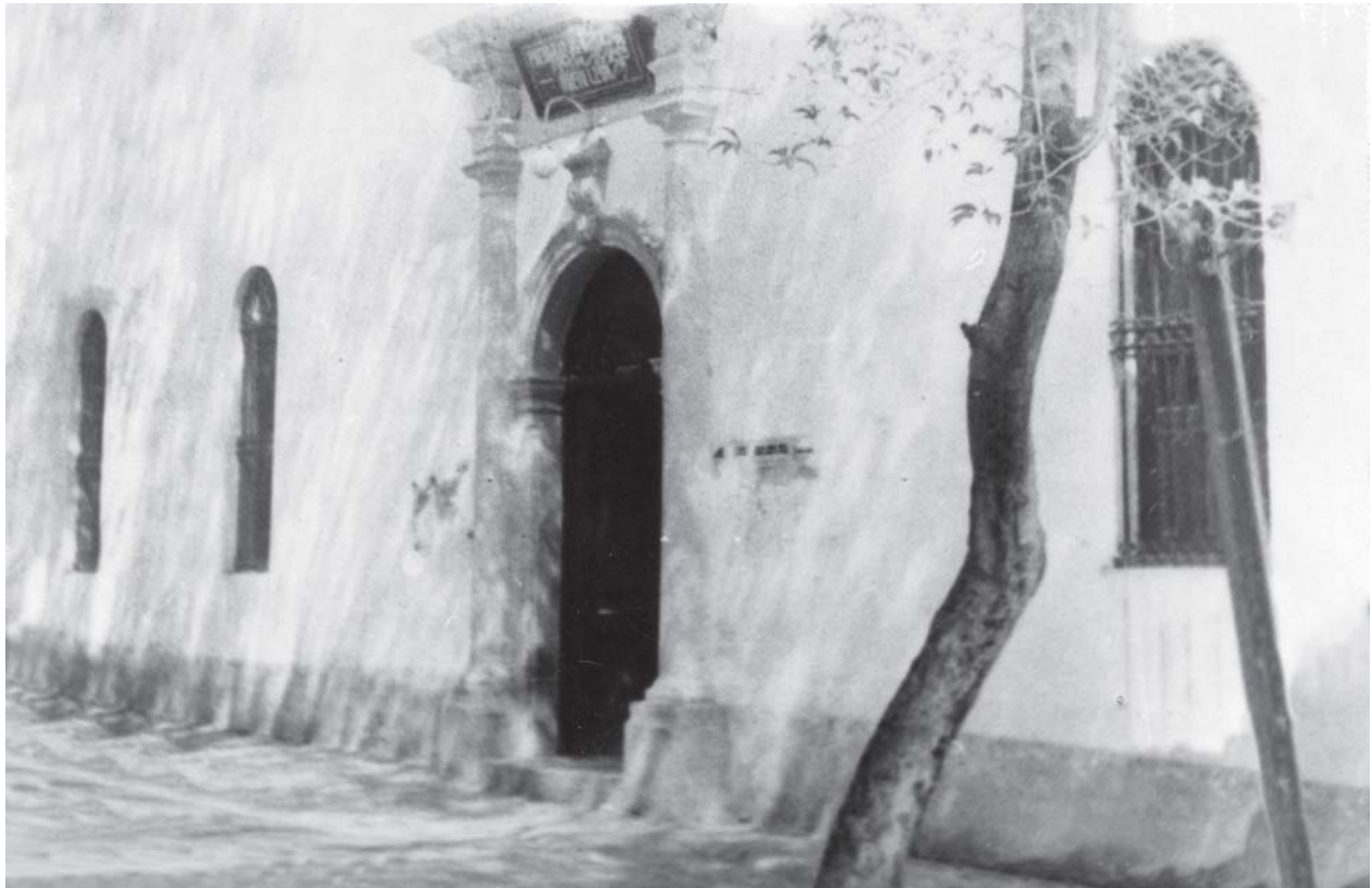
La Facultad de Medicina, situada en un edificio frente a la llamada “Placita de Medicina”, en la actual esquina de las calles de Cuauhtémoc y Matamoros, realizó una serie de mejoras materiales para recibir a la Facultad de Odontología.

trataba de un adeudo a cuya cuenta Odontología abonaba cantidades de manera continua 6 . Cabe aclarar que, a partir de marzo de 1940, los gastos de remodelaciones y equipamiento fueron cubiertos, al igual que la nómina de profesores, por la Tesorería General del Estado. El gobernador, Bonifacio Salinas Leal aprobó para su sostenimiento una partida de $ 8, 420.00 pesos 7 .