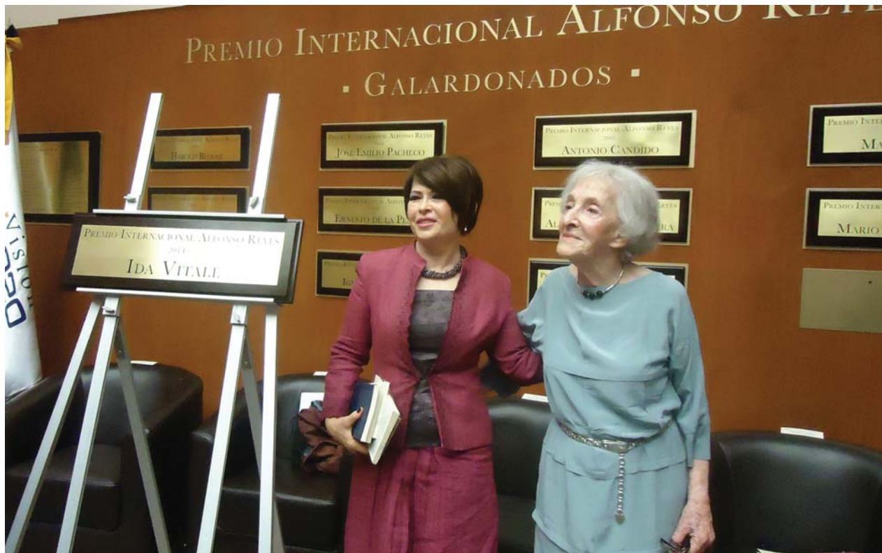
Con motivo de la develación de la placa conmemorativa del Premio Internacional Alfonso Reyes 2014, tuvo el honor de recibir a la poeta uruguaya Ida Vitale en la Capilla Alfonsina, el 31 de agosto de 2015.

humano, en su mayor parte conformado por ex alumnos suyos, la edición de la colección de poesía internacional El Oro de los Tigres , espacio para la traducción en homenaje a Alfonso Reyes y que publicó casi una cincuentena de volúmenes.