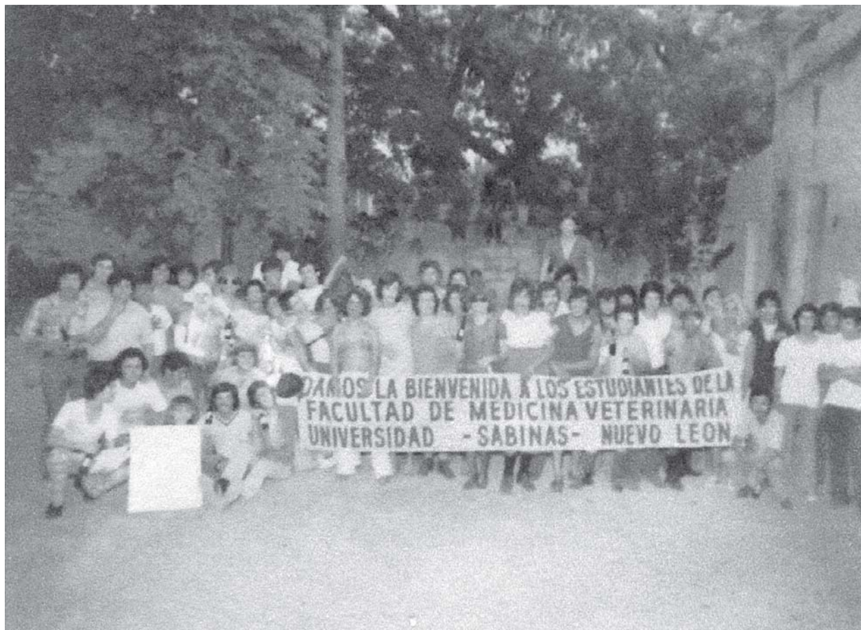
Cada inicio de cursos, el alumnado fundador y la población sabinense daban la bienvenida a los nuevos compañeros que se integraban a la Facultad de Medicina Veterinaria y Zootecnia.