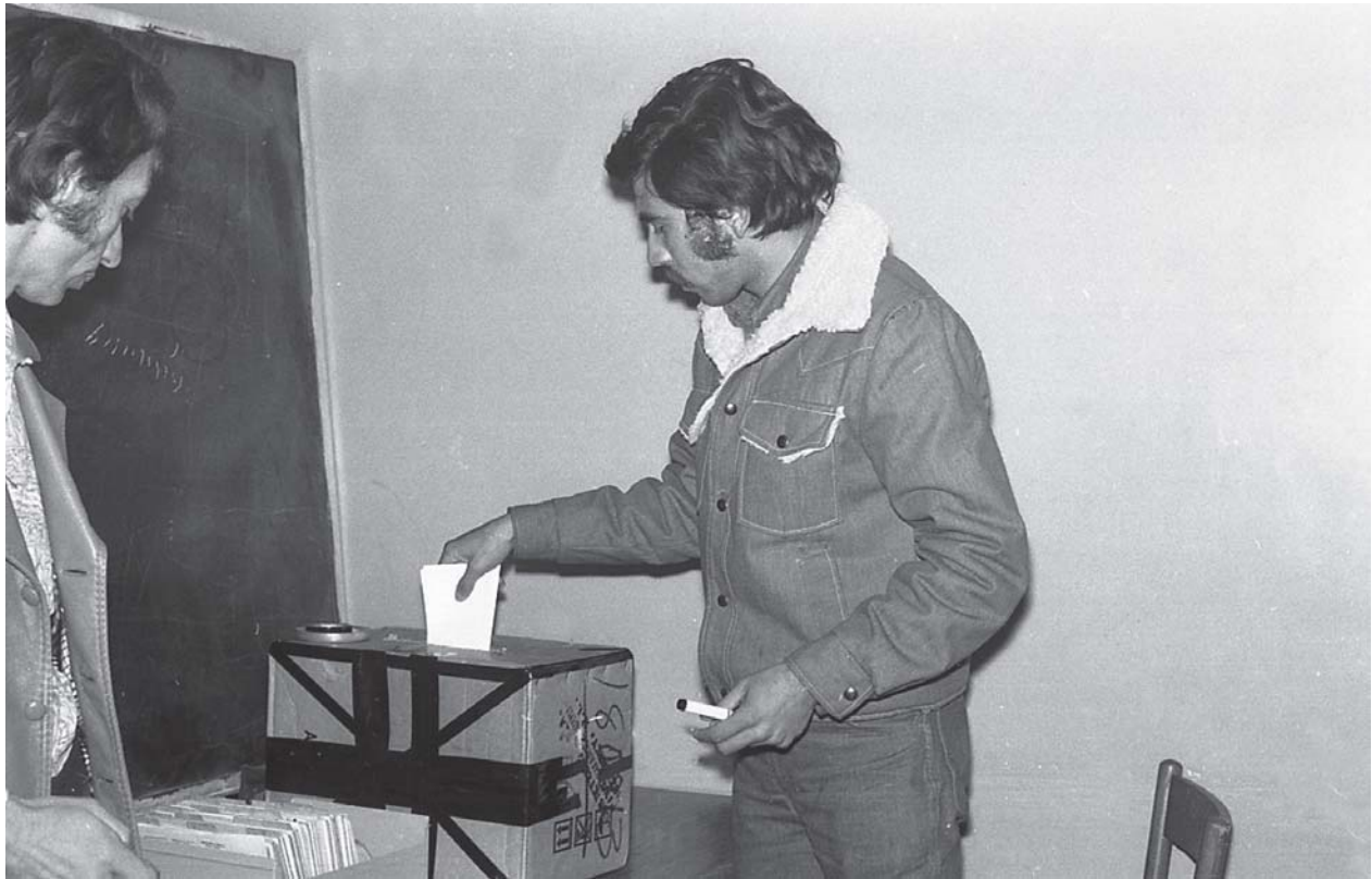
Tras el referéndum se anunció el cambio de sede de la Facultad de Sabinas Hidalgo a Monterrey.

En un acto determinante en la vida de la facultad, el 15 de enero de 1976 el alumnado, convocado a un referéndum llevado a cabo en un aula de la Preparatoria No. 15, respaldó la determinación de instalar el plantel en Monterrey.