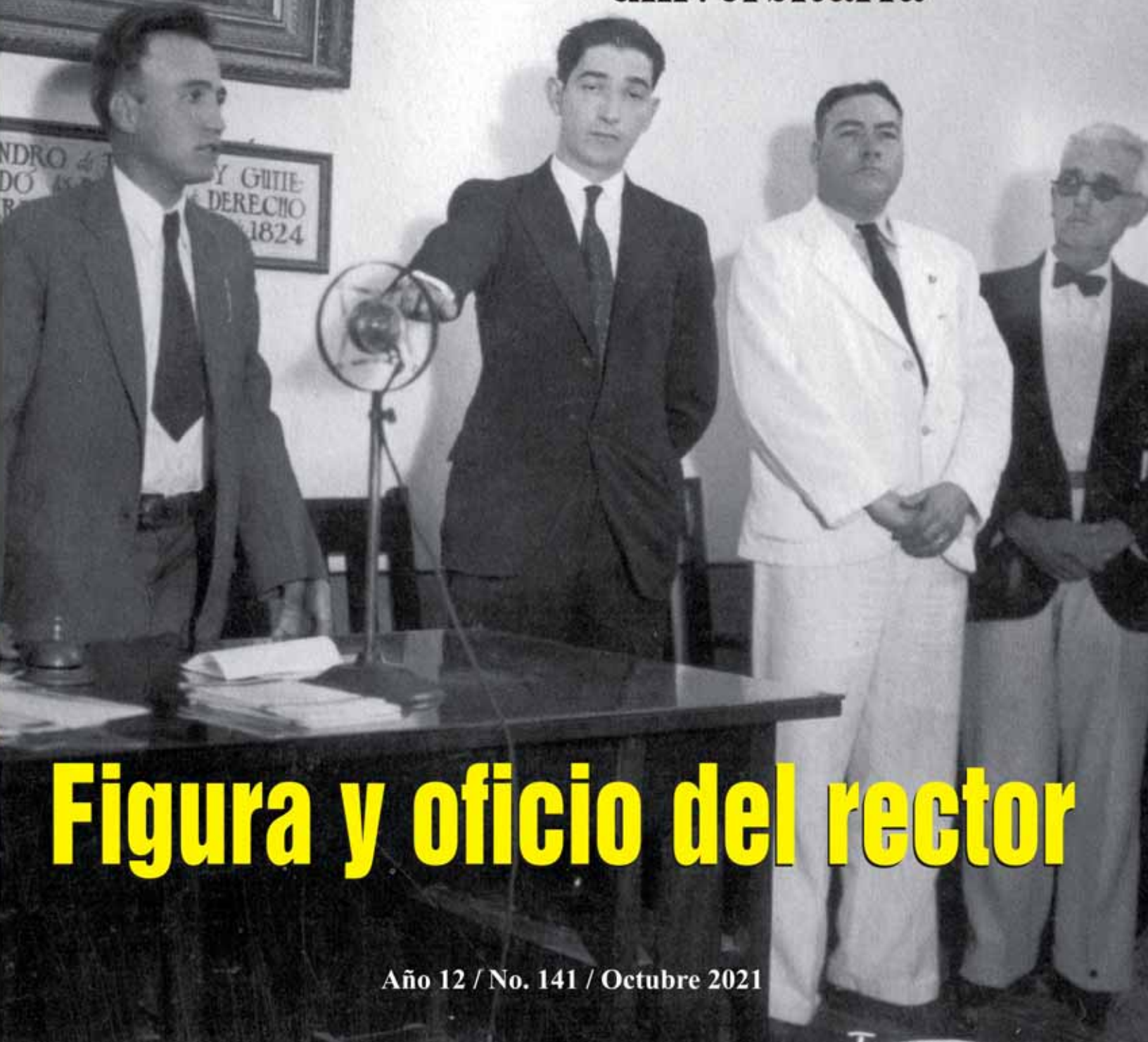
Figura y oficio del rector