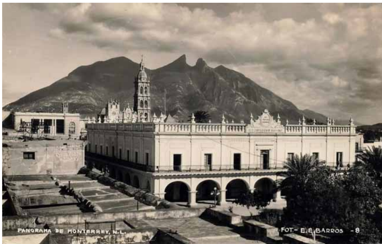
Uno de los rasgos evidentes de la generación cultural en Monterrey es su marcado regionalismo.

fue ocupado por Madero, quien se proclamó en contra de todo lo que representó el gobierno porfirista, alcanzó la presidencia (1911), y con ello dio inicio al periodo revolucionario, que adquirió su plenitud luego de su asesinato (1913) al lado del vicepresidente Pino Suárez.