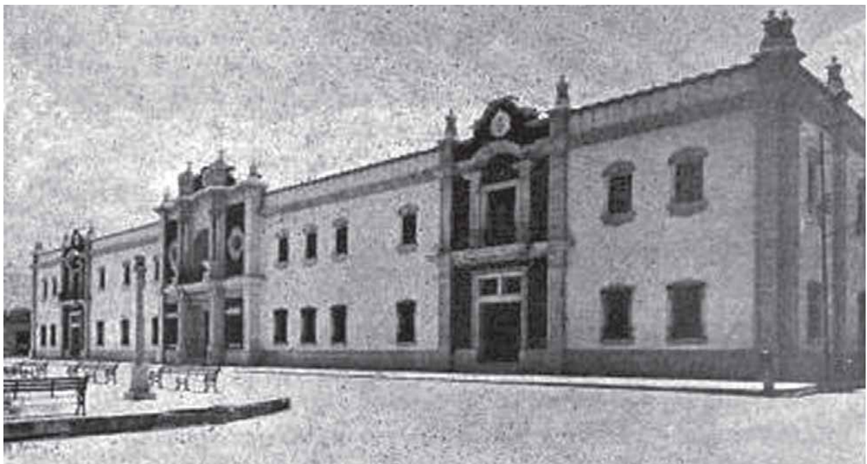
Dentro de sus aspiraciones humanistas Reyes ubicaba en el centro de la organización social a la Universidad. En la imagen, edificio del Colegio Civil, sede de la Universidad de Nuevo León.

En los apartados III y IV de ese ensayo, Reyes sitúa la construcción intelectual e histórica de la región, cifrada en el desarrollo de la ciudad de Monterrey. Sin mencionarlo por nombre, se refiere a las virtudes de la administración de su padre en el gobierno del estado por más de 20 años, “cuyos méritos sólo unos cuantos obcecados se atreven ya a escatimar”