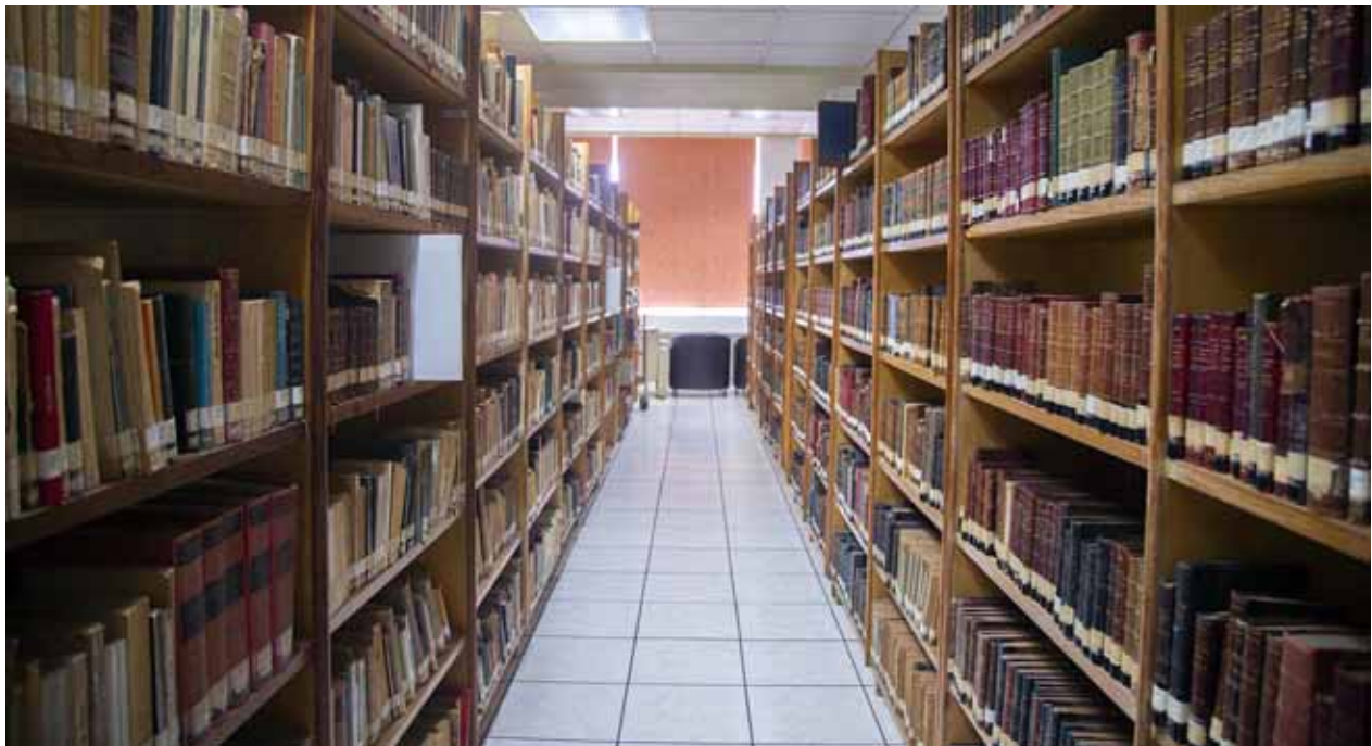
El traslado a Nuevo León de la biblioteca de Alfonso Reyes provocó una pugna que distanció en su momento los ámbitos culturales capitalino y regiomontano. En la imagen, la Capilla Alfonsina en la UANL.

Poco antes del advenimiento de los conflictos revolucionarios, que sin duda se vivieron con muchos menos sobresaltos en el noreste del país que en el centro, se presentó la posibilidad para que el mismo Bernardo Reyes capitalizara su liderazgo político llegando a la presidencia, pero fue incapaz de oponerse a Díaz, huyó del país y abandonó a sus partidarios ya establecidos el año anterior a la elección de 1910. El espacio vacío dejado por Reyes