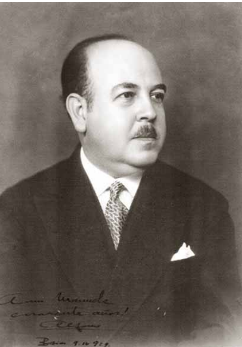
Alfonso Reyes, gran referente intelectual de la cultura nuevoleonense.

Rómulo Gallegos, electo presidente de Venezuela en 1947, aunque un golpe militar lo destituyó en 1948.