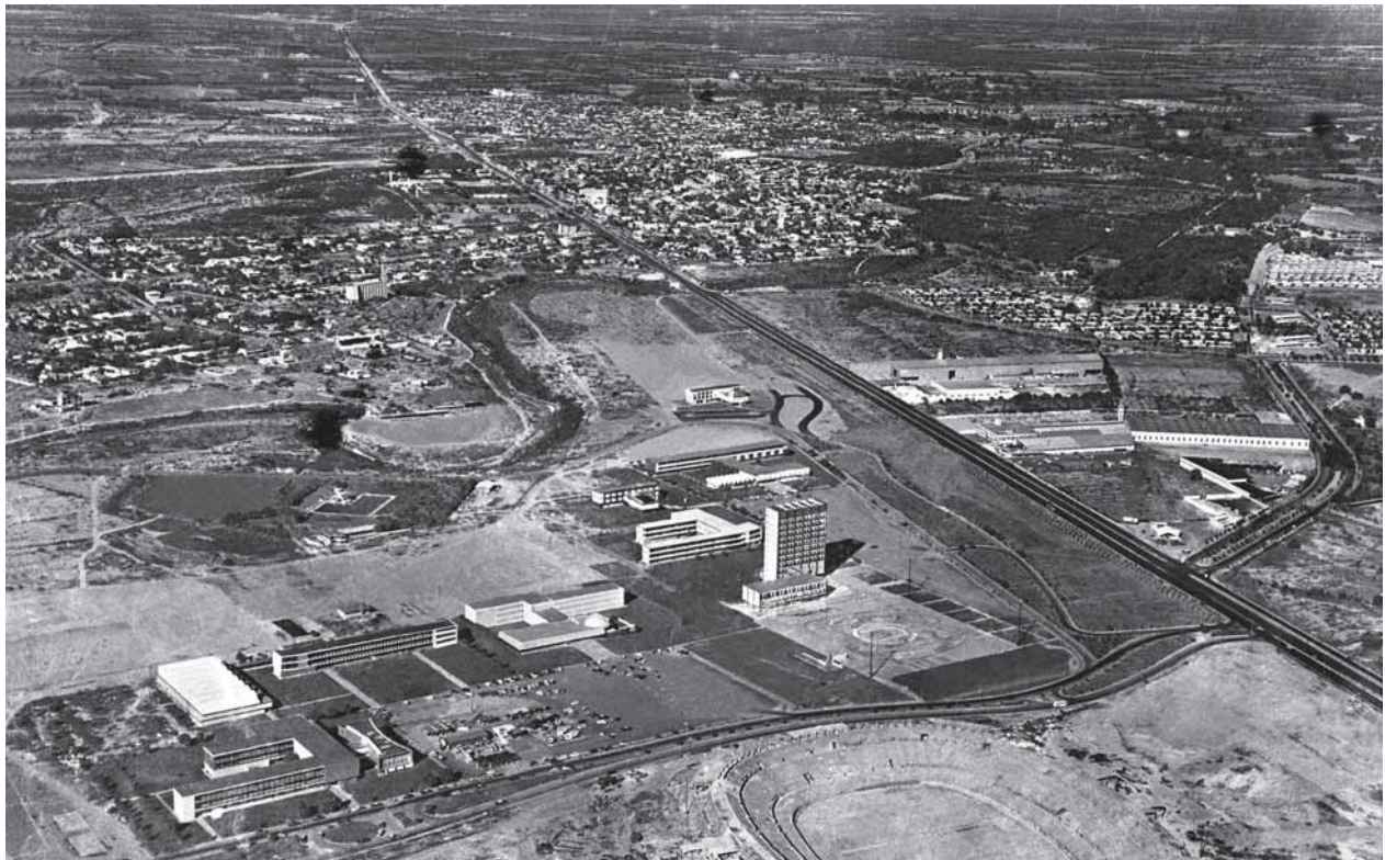
La fundación de la Universidad de Nuevo León significó un proyecto revolucionario educativo. En la imagen, construcción de Ciudad Universitaria.

4 Así lo observa Isidro Vizcaya en Los orígenes de la industrialización de Monterrey (2006).