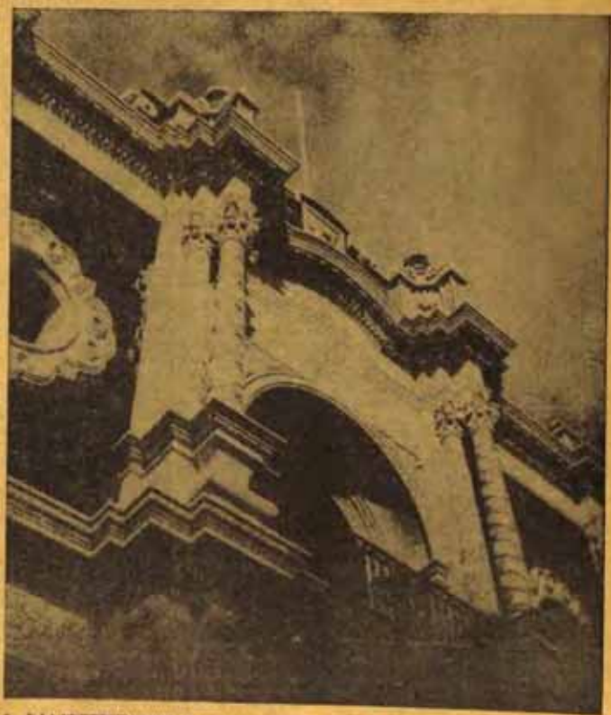
* Y LA UNIVERSIDAD DEL NORTE, LA NUESTRA, HARÁ DE TRADUCIR, ANTE LA AVANZADA SEPTENTRIONAL, EL SENTIDO DE LOS ANGELES NACIONALES, HACIENDOLAS MAS RESPETABLES CADA DIA...