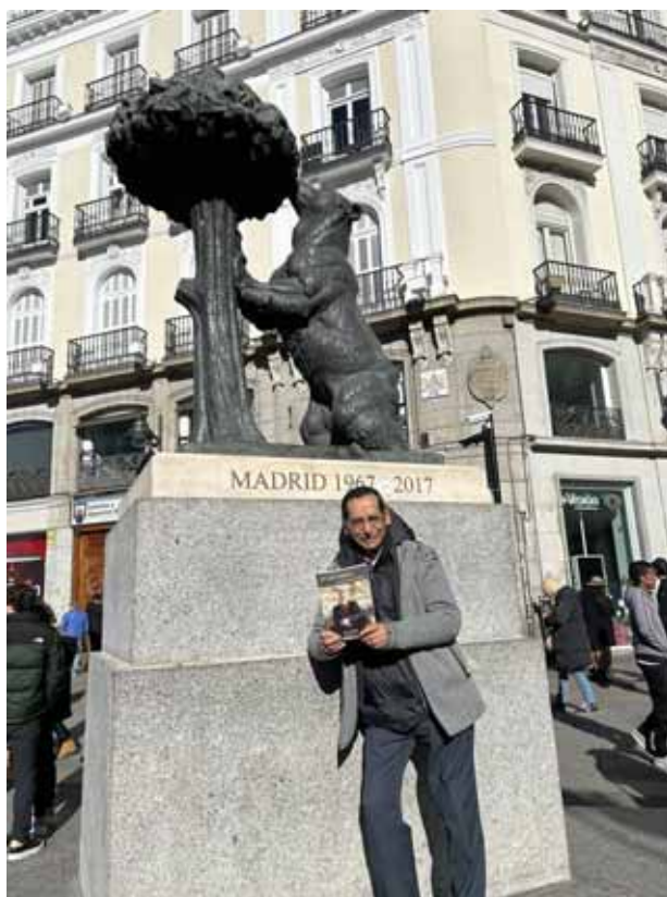
Durante sus viajes por Europa.