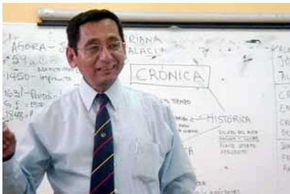
Ejerció la docencia por más de 45 años en la UANL como una extensión de su vocación periodística, siendo formador de generaciones de periodistas.

al día siguiente fuera a la Federación Mexicana de Fútbol. Me dijo: “maestro, estamos muy preocupados porque en la Federación no hay quien defienda a Tigres, Paredes es contador, no es habilidoso y además no es su medio el futbol, él va a seguir siendo el administrador, él va a administrar todo, usted va a dar la cara nada más por el rector y por la Universidad”.