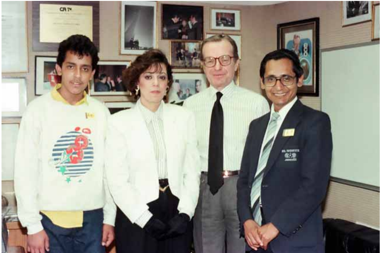
En las instalaciones de Televisa junto a Jacobo Zabłudowski durante la celebración del mundial de fútbol México 86.

tachones en la mano, algo que ya no se puede dar en el deporte.