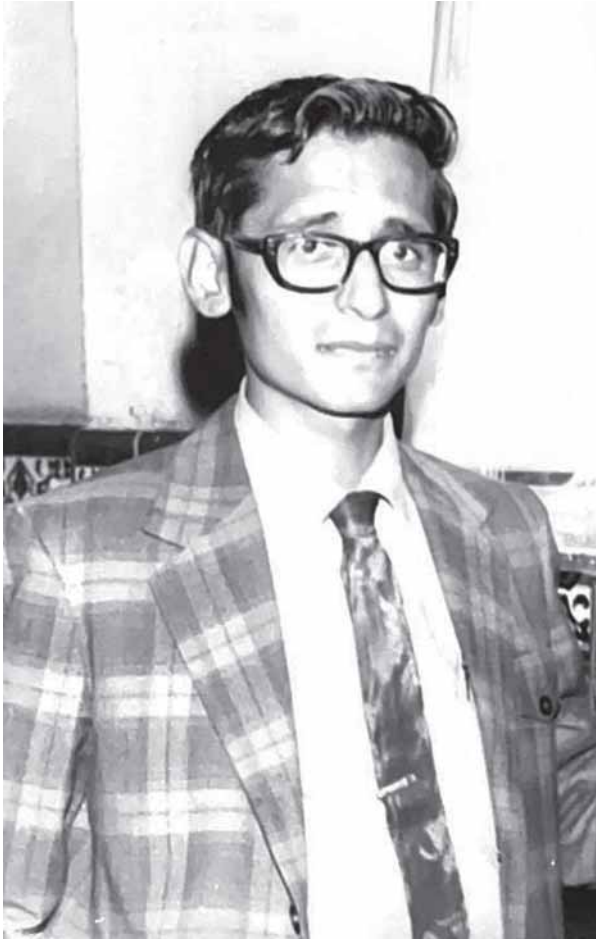
Con dedicación y esfuerzo superó adversidades.