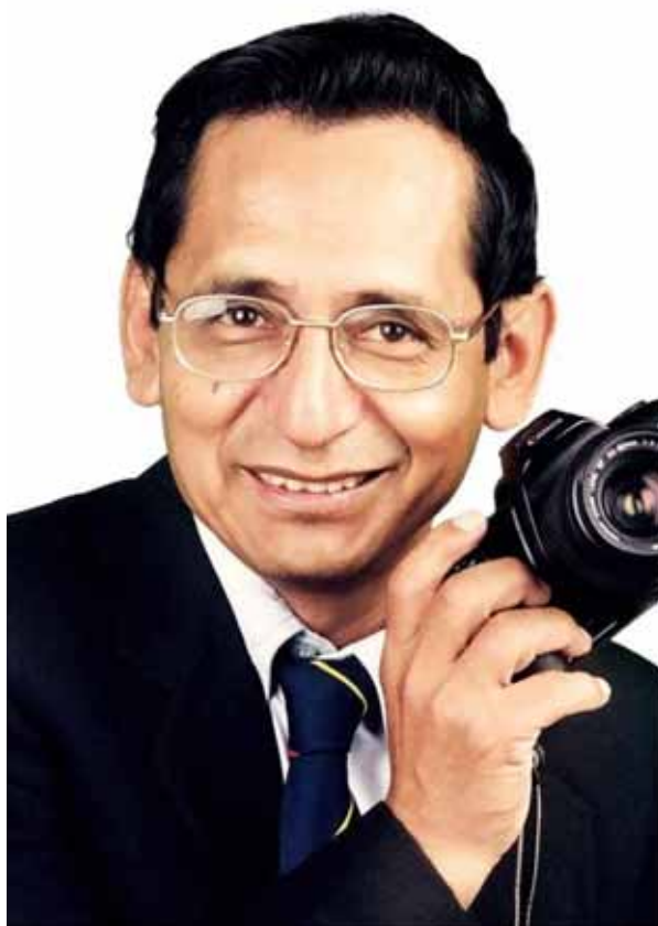
La fotografía, una de sus pasiones.