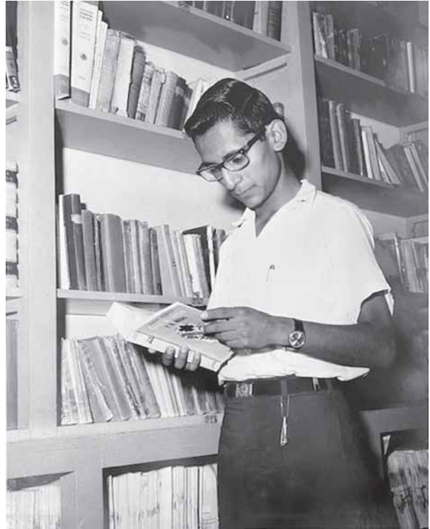
“La vida dura te va haciendo”. Agosto de 1966.

A punto de llevarme, sólo porque era un niño de once años, pero ¿qué hice? Me retó uno, de lejos