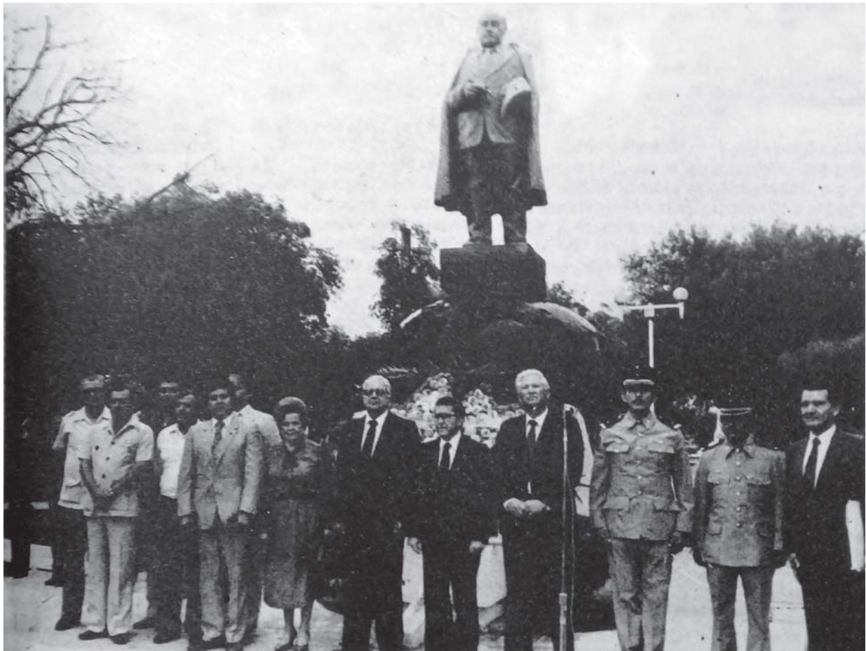
En el aniversario 95 del natalicio de Alfonso Reyes, se monta guardia de honor ante su monumento ubicado en la colonia Roma.