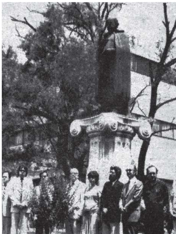
Guardia de honor ante el monumento de Alfonso Reyes, frente a la Facultad de Filosofía y Letras, el 17 de mayo de 1983.

El festival arrancó el lunes 7 de mayo con la