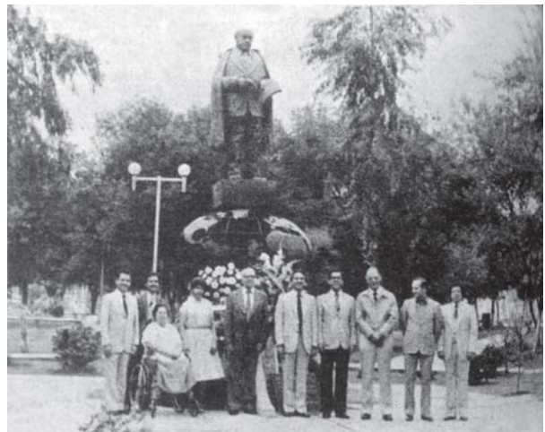
Raúl Rangel Frías encabeza, el 17 de mayo de 1982, la ceremonia de la guardia de honor ante el monumento de Alfonso Reyes en la colonia Roma.

Se dio apertura el 3 de mayo de 1983 con una exposición de libros seleccionados de la biblioteca personal de Alfonso Reyes en la Capilla Alfonsina. El público pudo apreciar libros antiquísimos, extraños y muy apreciados por Reyes por su forma singular y su contenido. Uno de los volúmenes especiales era uno que contenía estampas que relatan la historia de Don Quijote de la Mancha.