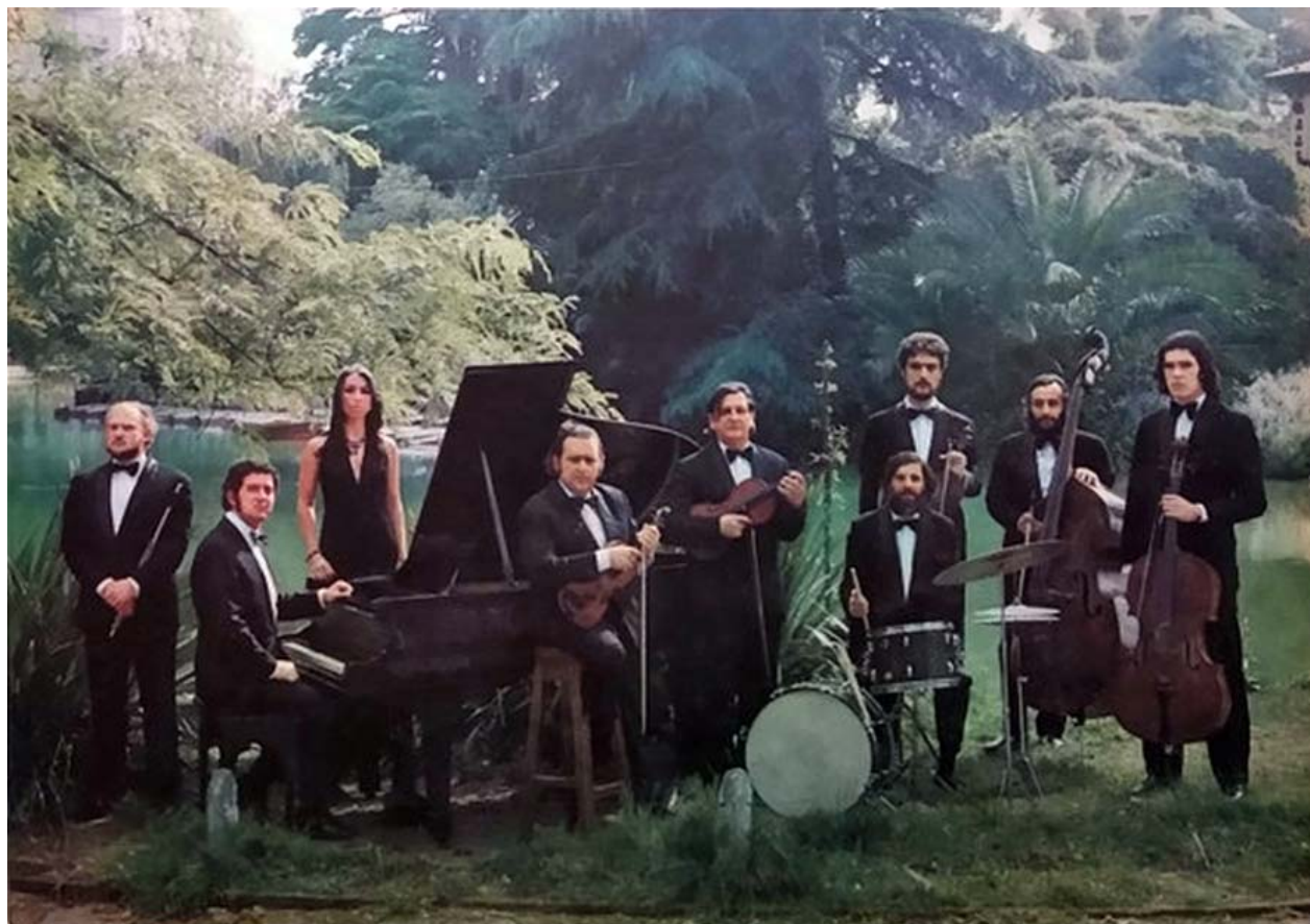
Camerata de Punta del Este

de Lenguas Romances y con especialidad en Literatura Iberoamericana en la Universidad George Washington de Washington, D. C., habló sobre “Caminos cruzados: epistolario de Alfonso Reyes y Manuel Toussaint”, destacando las claves de la personalidad literaria de Reyes: amistad y cortesía que se refleja en su vasto epistolario, el cual podía ser explorado en la Capilla Alfonsina.