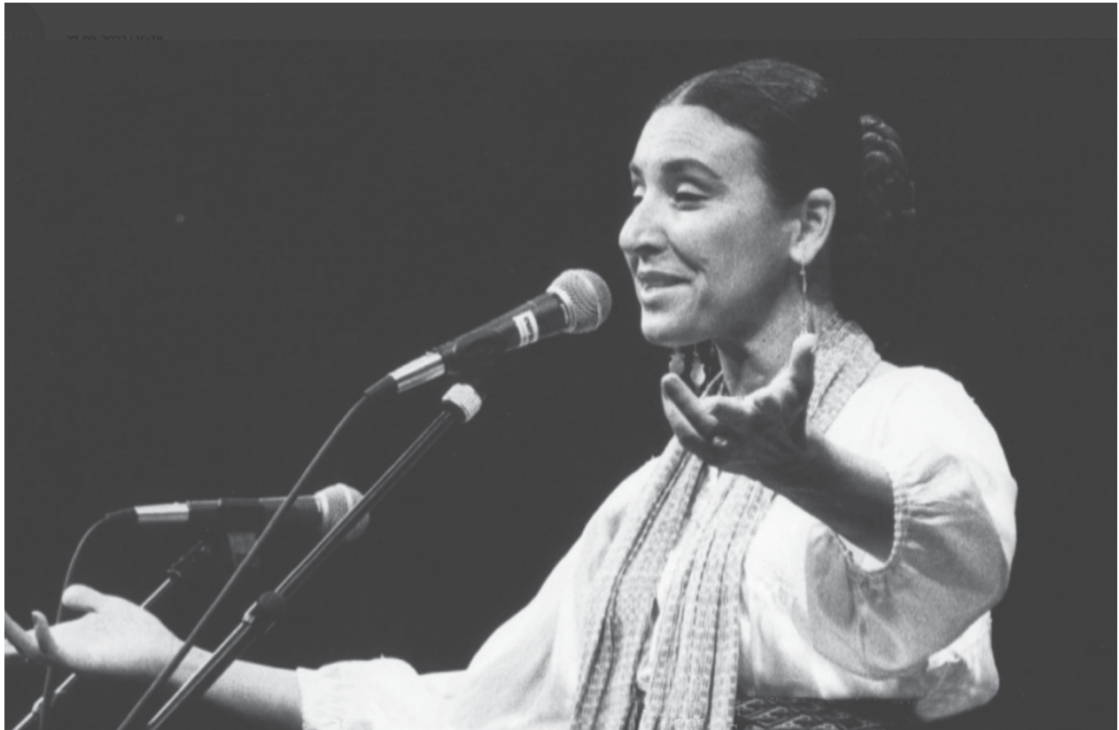
La cantora mexicana Amparo Ochoa contaba con una trayectoria que la convirtió en una figura fundamental del canto popular latinoamericano y de la militancia feminista.

la época precortesiana, conjugándola con la fórmula literaria de Alfonso Reyes con la que describió Tenochtitlán en su famoso ensayo publicado por primera vez en 1917.