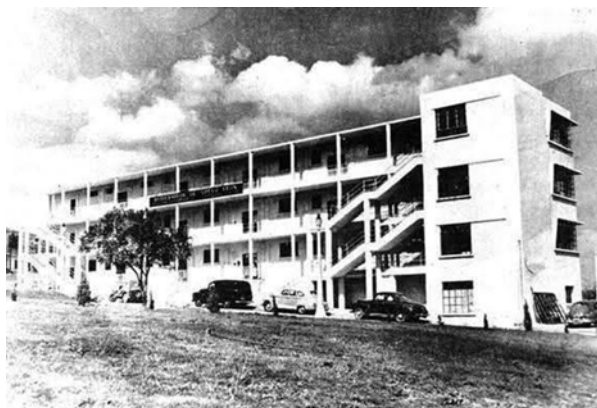
En el segundo piso del edificio situado en la falda oriente de la loma del Obispado se ubicó el Museo Regional de Historia Natural.