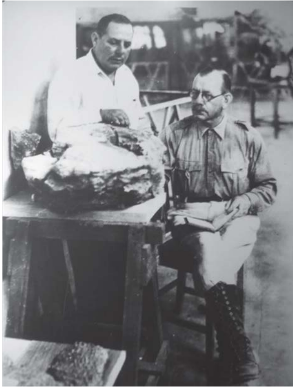
Las colecciones para el museo se enriquecieron con las exploraciones geológicas y paleontológicas del estado llevadas a cabo por el doctor Federico K. G. Mullerried. ( Museo de Paleontología Eliseo Palacios Aguilera )

de todas ellas se obtuvieron suficientes materiales de la fauna y flora regionales.