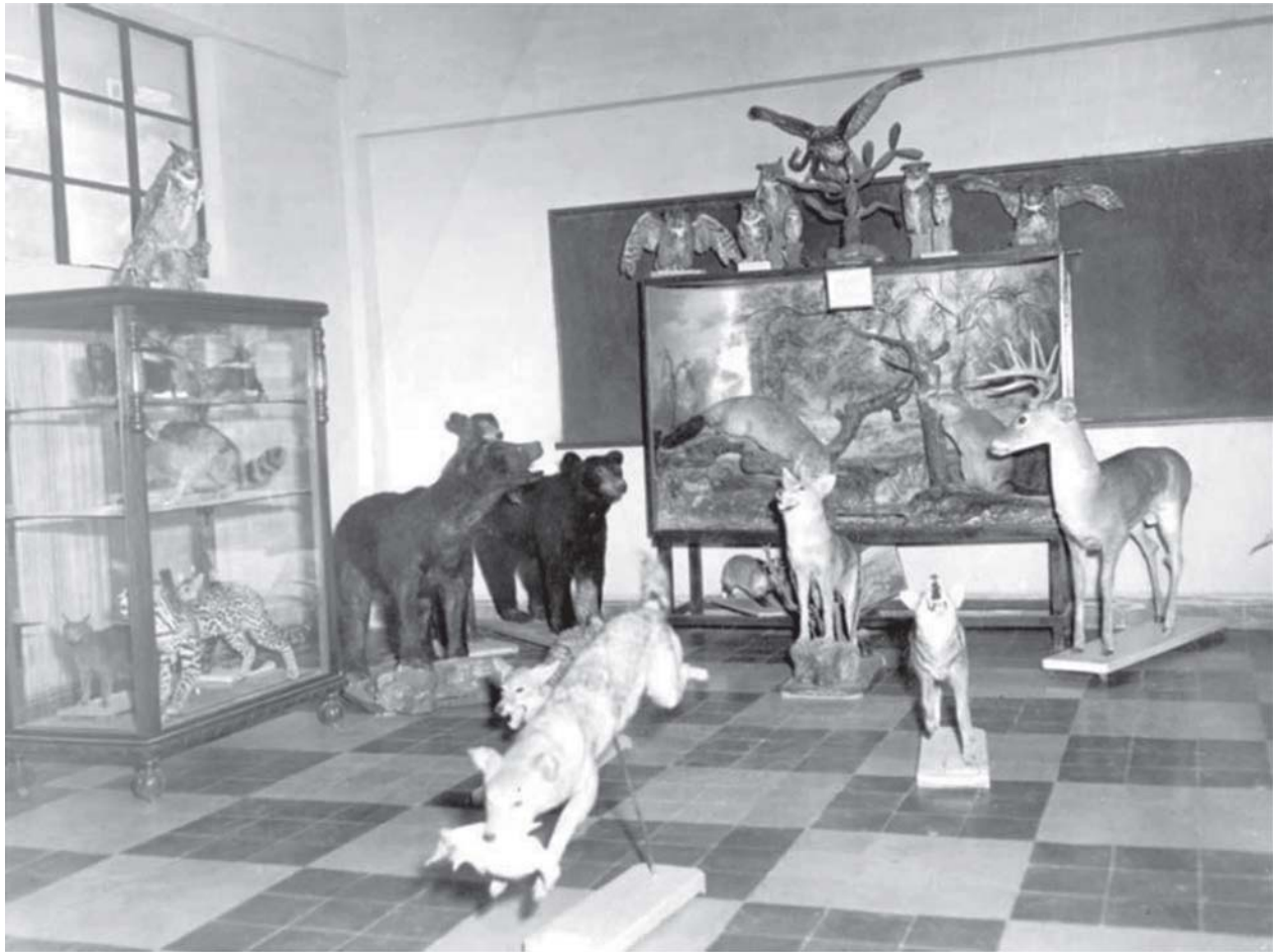
En las salas del museo se exhibía una gran variedad de ejemplares de animales de la región y de otros lugares del país, como pájaros, reptiles y batracios.