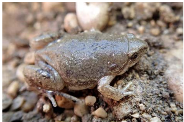
Gracias a las exploraciones se encontraron los anuros Scaphiopus couchii Baird y Microhyla olivacea , lo que hizo posible extender su área de dispersión.