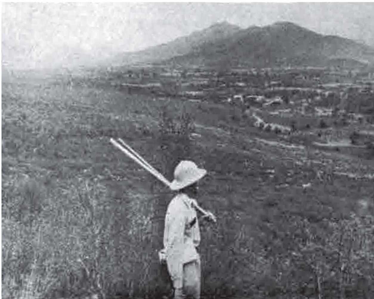
En las excursiones se recogieron abundantes ejemplares de animales, plantas y minerales. En la imagen, en un paraje en torno al Cerro de la Silla y el Cañón de la Boca.

primeras colecciones para el Museo de Historia Natural mediante sus excursiones de exploración a lo largo de rutas que comprendieron localidades típicas de la región en torno a Monterrey, en las que recogieron abundantes ejemplares de animales, plantas y minerales.