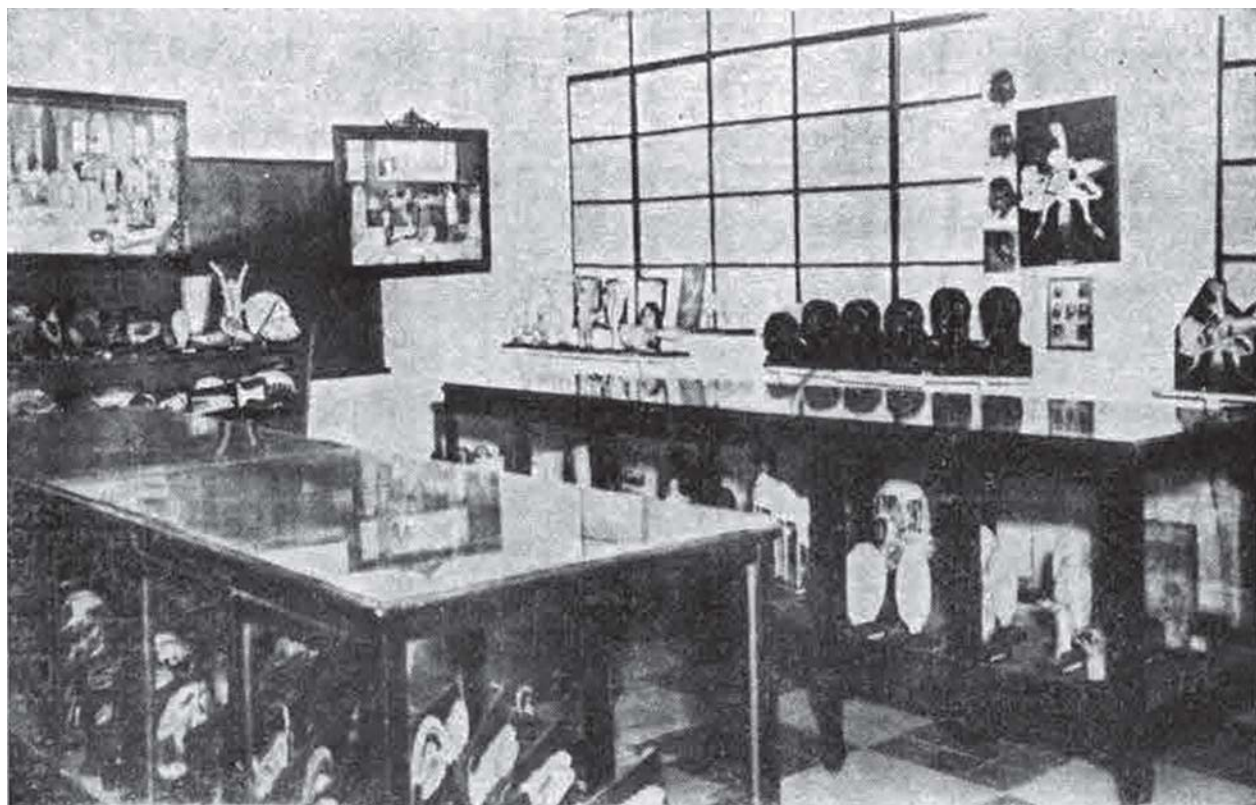
Una de las salas del Museo Regional de Historia Natural.