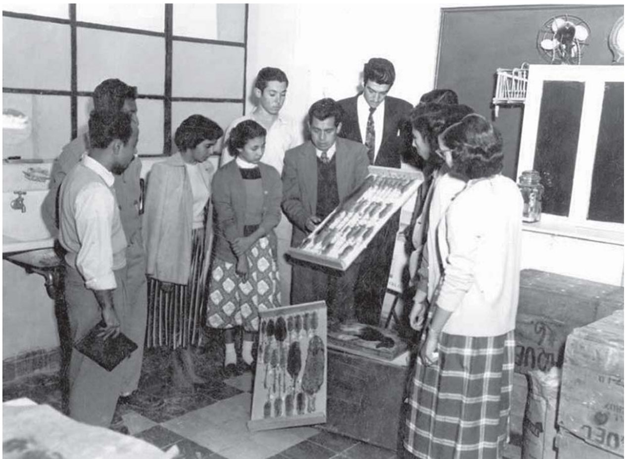
Tras su apertura se destacó el valor educativo del Museo Regional de Historia Natural, uno de los primeros museos públicos de Monterrey. ( Ciencia-UANL )

La Facultad de Biología se instaló en septiembre de 1956 en una casa antigua de sillar ubicada en la