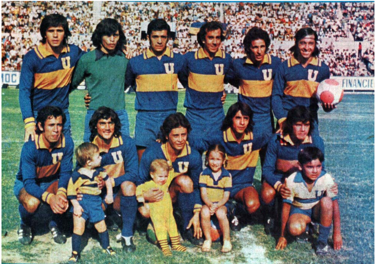
Este es el equipo de los Tigres que se proclamó monarca de la Liga de Segunda División, al superar a los Leones Negros en juego celebrado en Guadalajara, Jalisco el 19 de mayo de 1974, regresando a Monterrey con el pasaporte como club de Primera División.

máxima categoría. Fue un duelo de equipos universitarios y felinos.