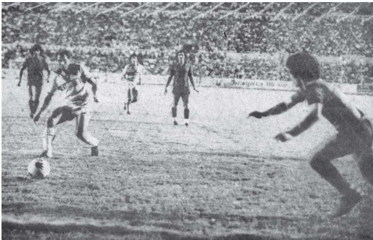
En el partido final de ida realizado en el Estadio Universitario, el 3 de junio de 1982, los Tigres lograron una mínima ventaja ante el amplio favorito Atlante.