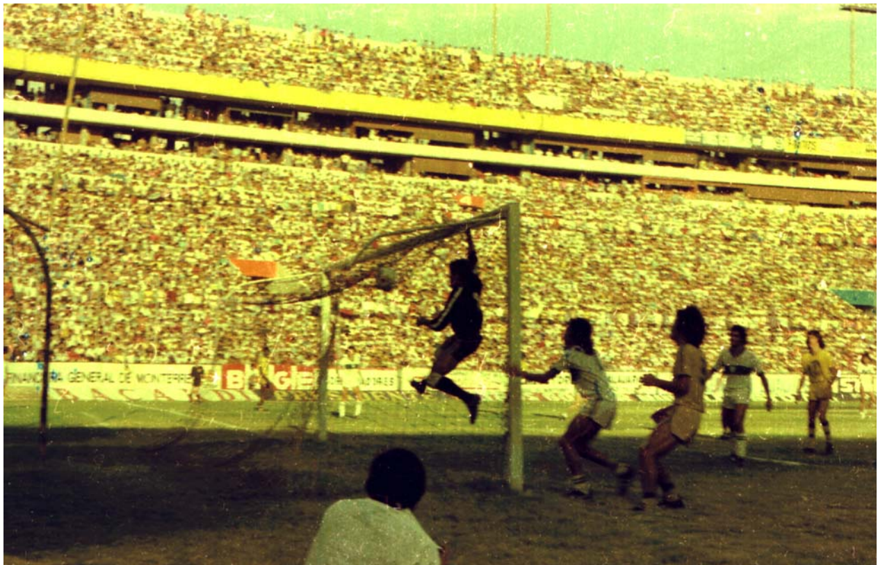
En un duelo disputado en el Estadio Universitario ante el equipo de los cañeros del Zacatepec, el 11 de junio de 1977, los Tigres lograron salvarse del descenso.

En el segundo tiempo apareció de nuevo “Iauca” para anticipar la salida del portero Palacios a tiro de