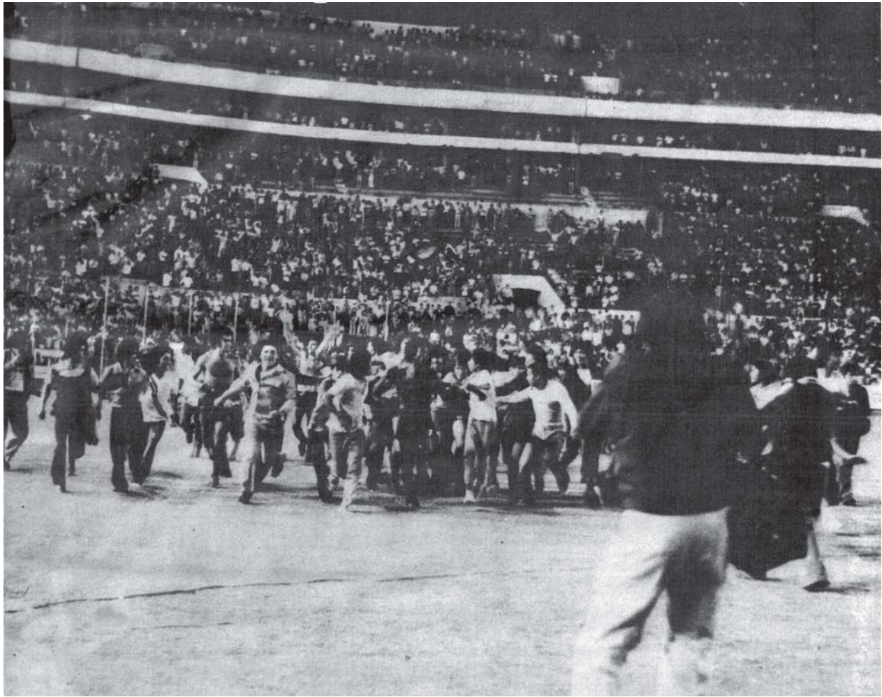
Con el silbatazo final por parte del árbitro, los aficionados desbordados por el júbilo ingresaron a la cancha del Estadio Universitario para felicitar a los jugadores felinos, 4 de octubre de 1975.